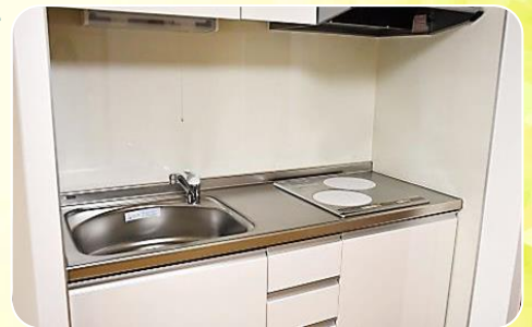
清潔感のあるキッチン