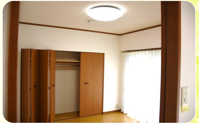
南向きのお部屋は明るく大きな収納もあります