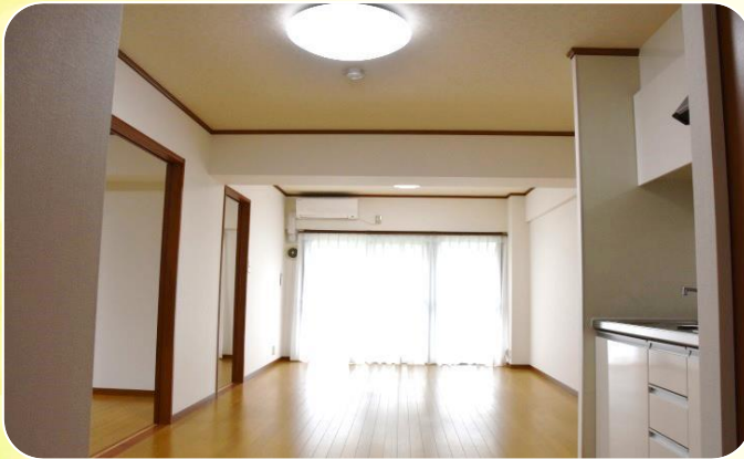
70 m 2 ・2LDKの広々とした空間です