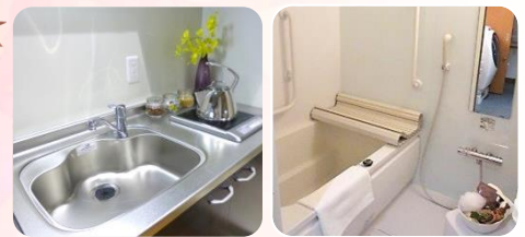
各部屋 IH キッチンと浴室を完備 (2017/7 撮影)