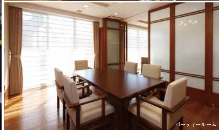
パーティールーム