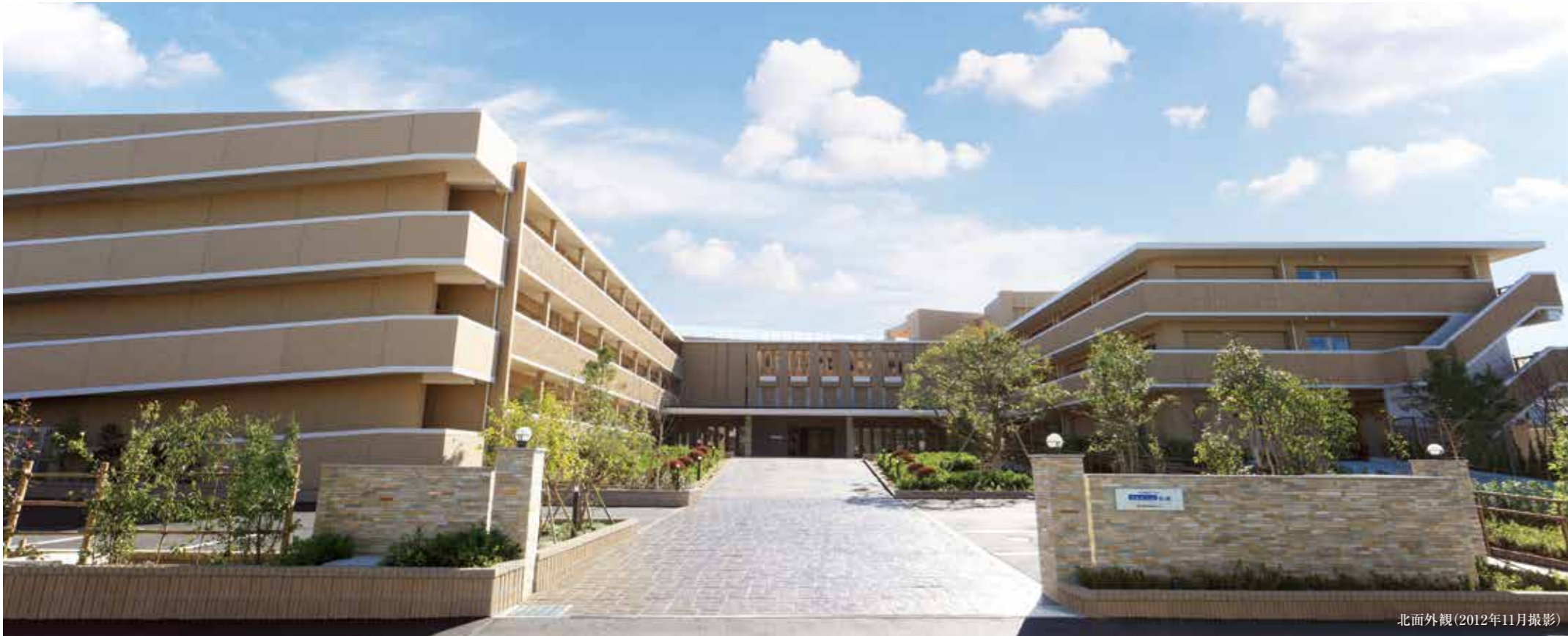
北面外観(2012年11月撮影)