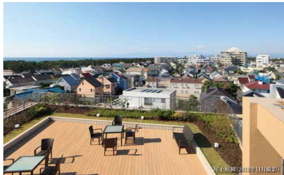
屋上庭園(2012年11月撮影)

中世ヨーロッパの貴族が好んで建てたというマナーハウス。 「ネオ・サミット茅ヶ崎」の外観デザインには、その壮麗さと洗練された佇まいを取り入れました。 湘南茅ヶ崎の地にふさわしく、 また周辺に広がる豊かな自然の風景と融合する、風格ある「誇れる屋敷」です。