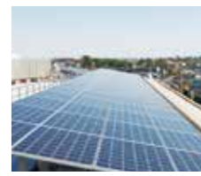
太陽光ソーラーパネル

東京ドーム3.8個分の森林に匹敵するCO2排出量の削減 ※2・※3 「ネオ・サミット茅ヶ崎」では、共用部LEDに加え、太陽光発電・省エネ設備採用により、東京ドーム約3.8個分の森林に匹敵するCO2排出量削減を実現しています。