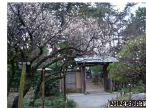
風情ある佇まいを残す松籟庵 (現地より約790m)