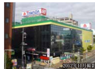
2012年11月撮影 ヤマダ電機(現地より約1,800m)