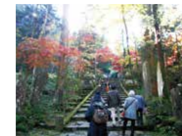
日帰りバスツアー