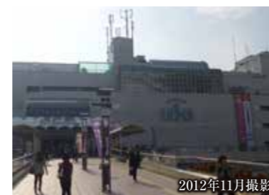
2012年11月撮影 ラスカ(現地より約1,500m)