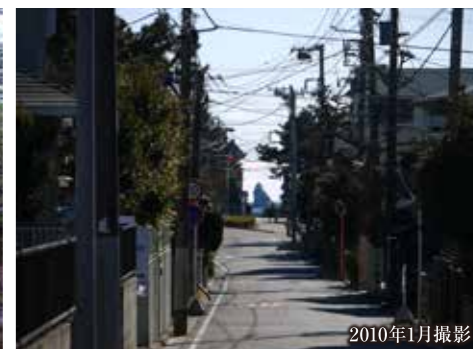
ラチエン通り (現地より約850m) からえぼし岩を望む