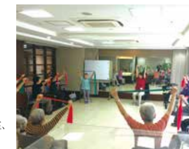
アンチエイジング教室