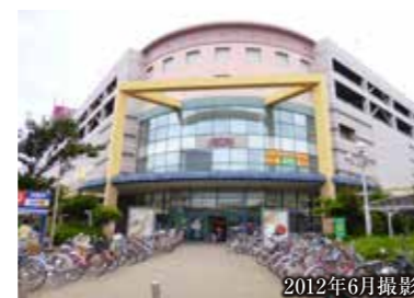
2012年6月撮影 イオン茅ヶ崎中央(現地より約2,300m)

「ネオ・サミット茅ヶ崎」の周辺には、いくつもの商業施設があります。雄三通りやサザン通り、ラチエン通りや一中通りなど。いずれの通りにも、さまざまなショップが軒を連ね、通りを散策するだけでも、楽しいひとときをお過ごしいただけます。また、茅ヶ崎駅北口にまで足を伸ばせば、イトーヨーカドーをはじめとした商業施設が充実しています。